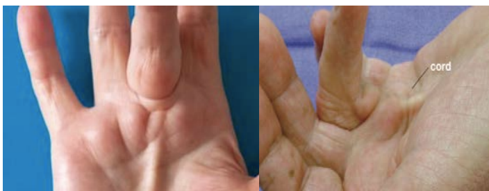
Figure 1. Brides de Dupuytren

Aucun examen complémentaire n'est nécessaire au diagnostic.